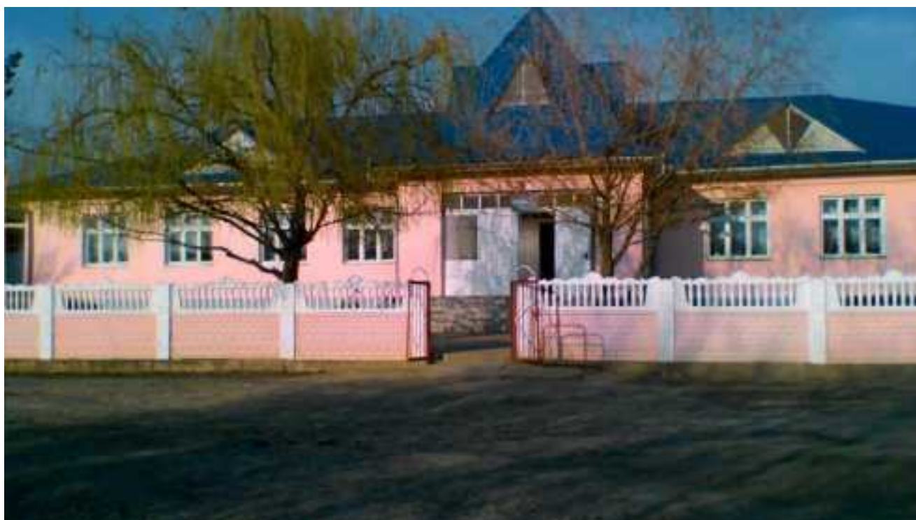
Instituția preșcolară “ Muguraș ” - renovată în anul 2007 cu suportul FISM