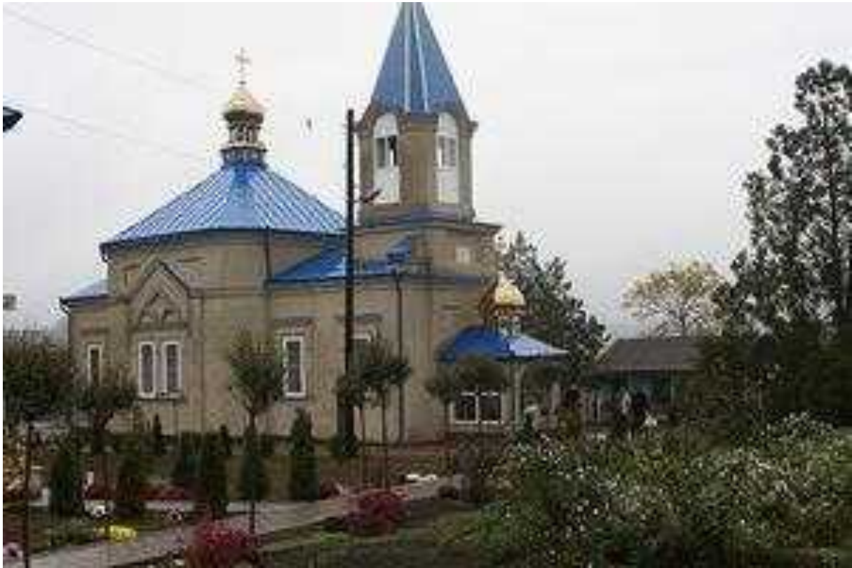
Biserica satului Chetriș cu Hramul Sfântului Ierarh Nicolae – 22 mai