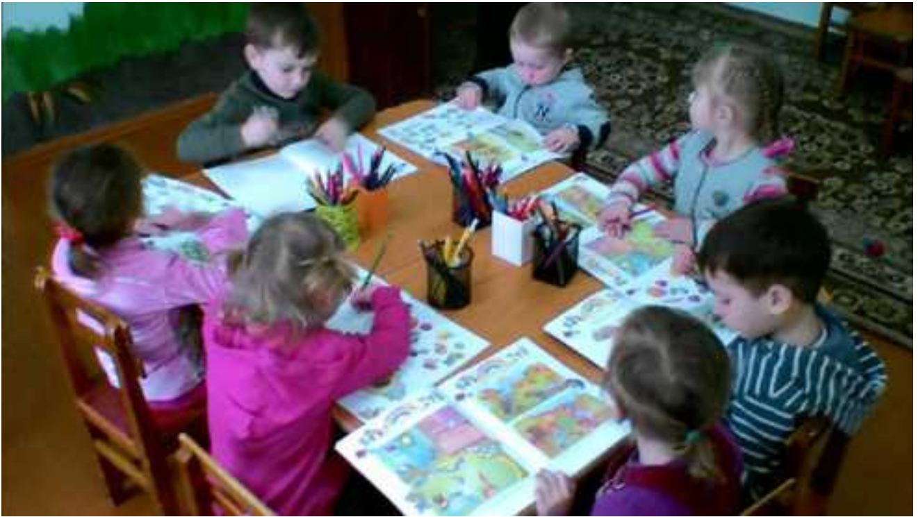
Generația tînă ră de chetrișeni – moment de creație